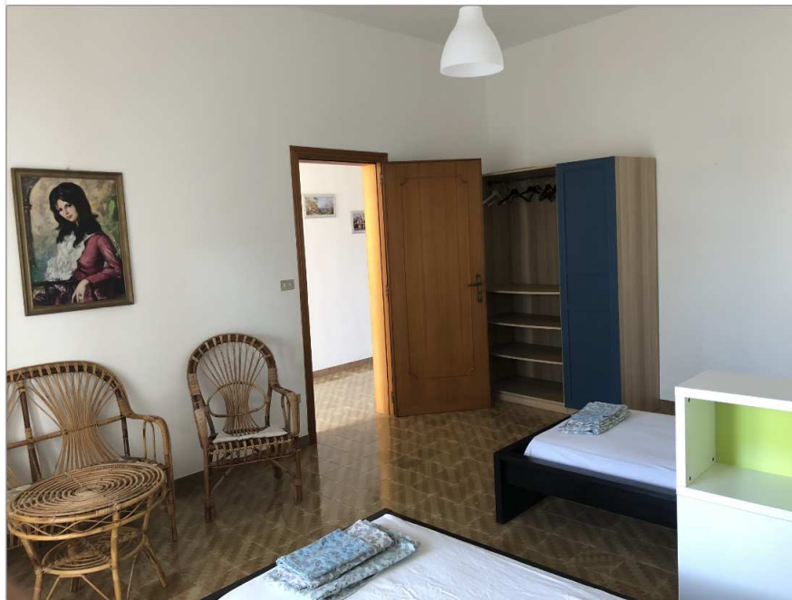
App. 6 grosses Zimmer, Wohnküche