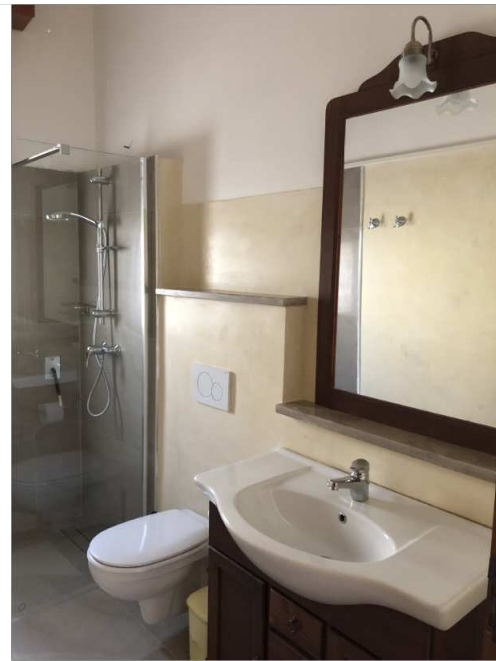
App. 5-6 Bad