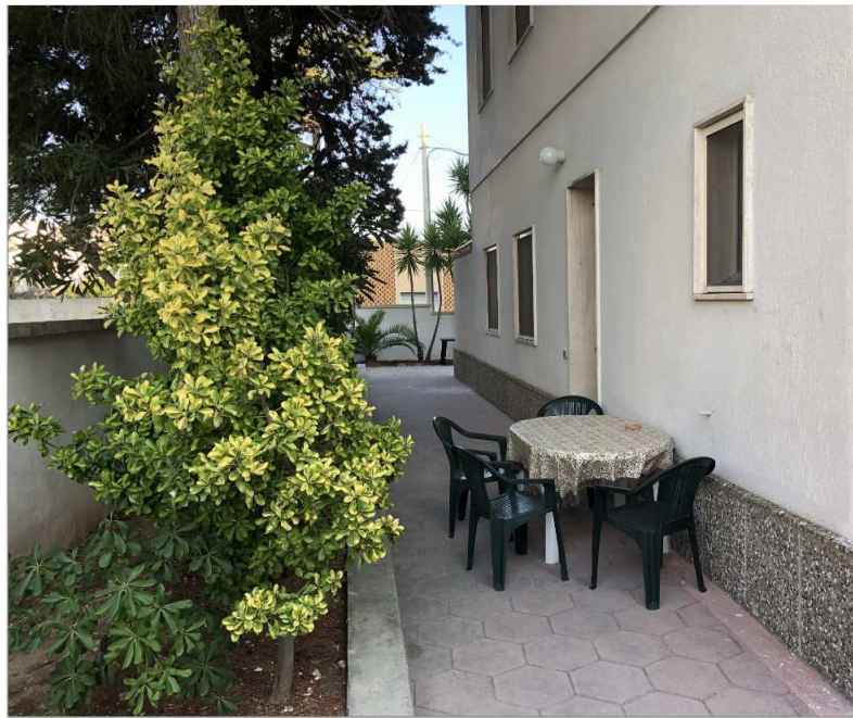
App. 1, Aussenbereich