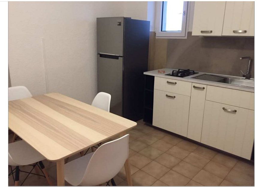
Bad und Küche