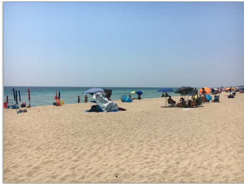
4 Fussminuten liegt der 1 Km langer Sandstrand von Lido Marini.